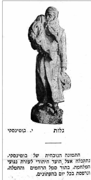
איור 1: "גלות" 22

היהודים הואשמו בריגול ובשיתוף פעולה עם האויב הגרמני כלגיטימציה לגירושם מאזורי הגבול של החזית המזרחית שהלכו והתרחבו בשל נסיגה מזרחה של הצבא הרוסי עקב לחץ כוחות גרמניים ואוסטריים. כך לדוגמה פרסמו מפקדו הראשי של צבא הצאר וראש מטהו, בתחילת אפריל 1915, צו לפיו "כל מקום שהחזית מתקרבת למקומות מושב היהודים עליהם לעזוב תוך 24 שעות את מושבם". 21