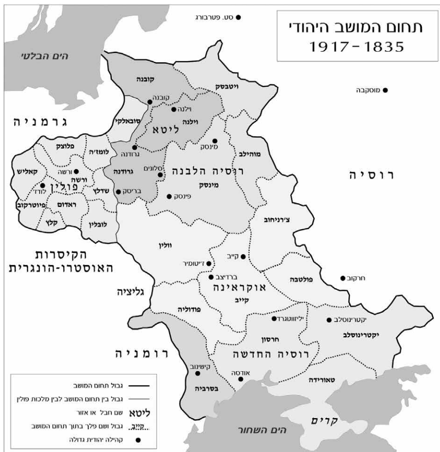
מפה 1: תחום המושב היהודי

יהודי אירופה מתחילת 1915 עולה כי רוב יהודי העולם התגוררו באירופה ומחציתם ברוסיה הצארית: