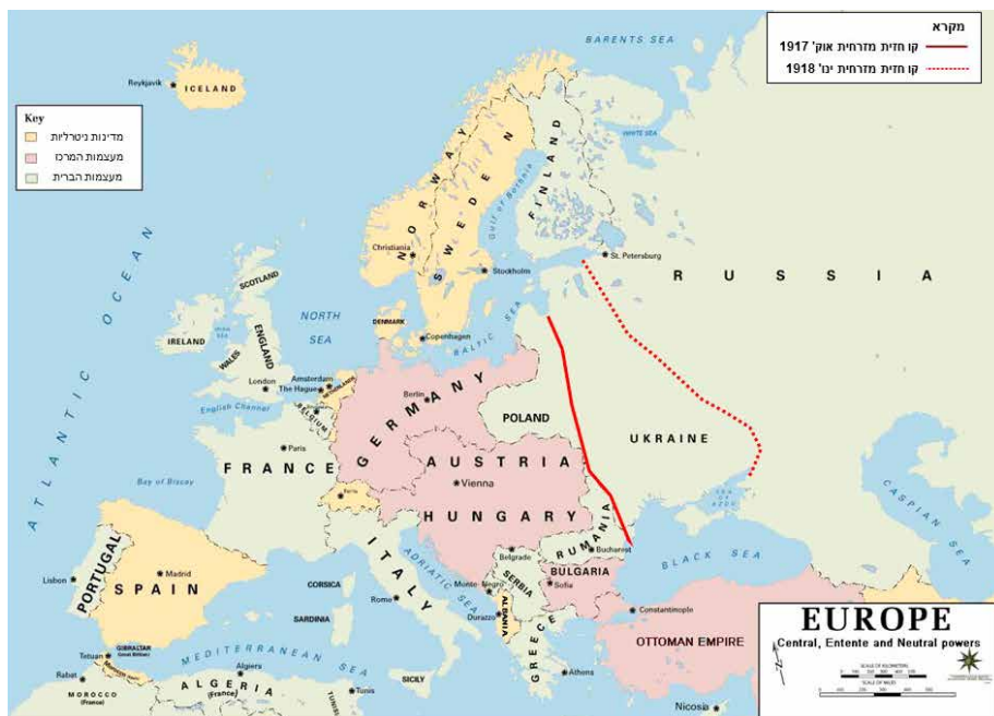
מפה 2: הצדדים הלוחמים באירופה במלחמת העולם הראשונה והשינויים בקו החזית המזרחית 18

פודוליה ובסרביה הדרומיים. בשלהי 1917 הרחיבו הגרמנים ושותפיהם את שטחי הכיבוש וקו החזית החדש הוסט שוב מזרחה (ראו קו אדום מקוטע/מקווקו במפה 2).